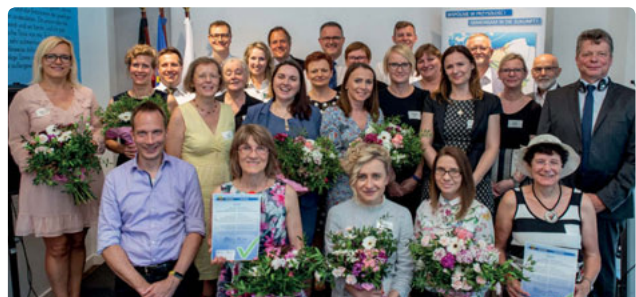
Photo de groupe de l'ensemble des équipes des projets primés Group photo of all the award-winning projects teams