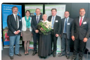
© Projekt „Gemeinsam für den Grenzraum“

Support for cooperation between actors from Brandenburg, Saxony and Poland and cross-border marketing of shared cultural heritage