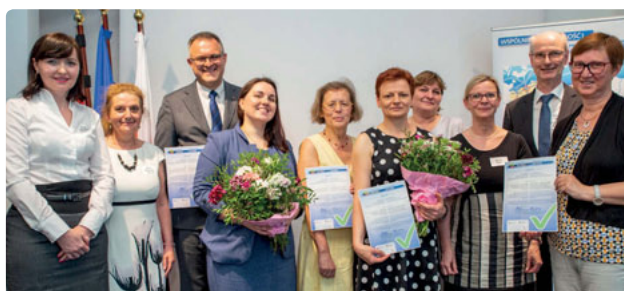
Les partenaires des deux projets pour l'éducation interculturelle et l'acquisition de la langue du voisin se réjouissent d'avoir reçu un prix / The partners involved in the projects for intercultural and bilingual education are pleased to have won the award

Both projects reflect on the need to fill a gap that still exists after almost three decades of good German-Polish neighbourliness: the lack of reliable structures in state education systems that guarantee the continuous availability of education in the neighbouring language in the immediate neighbourhood, from preschool right through to vocational and university education. Both projects prove that there is great interest in learning the neighbouring language and determination to fundamentally improve the opportunities for learning it.