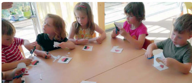
Séance commune d'activités manuelles dans la maison des enfants germano-polonaise « St. Franziskus », Ostritz / Joint arts and crafts session at the German-Polish "St. Franziskus" bilingual preschool, Ostritz

Le projet « Acquisition de la langue du pays voisin du jardin d'enfants à la fin de l'école », réintroduit ou perfectionne l'enseignement de l'allemand et du polonais dans les trois sous-espaces de l'eurorégion Pomerania, tout en véhiculant diverses approches de l'éducation dans un contexte plurilingue. Les pédagogues suivent des formations poussées et les parents sont impliqués pour une mise en contact précoce des enfants avec la langue et la culture du pays voisin.