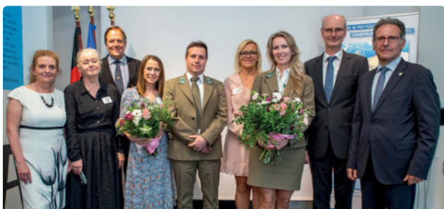
Mention spéciale pour les projets « Smart Integration » et « Pont de l'Europe Siekierki-Neurüdnitz » / Award for the projects "Smart Integration" and "European Bridge between Siekierki and Neurüdnitz"